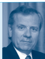
Jaap de Hoop Scheffer Titulaire de la Chaire « Kooijmans » pour la Justice, la Paix et la Sécurité, Université de Leyde (Pays-Bas)